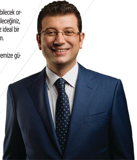
EKREM İMAMOĞLU Beylikdüzü Belediye Başkanı

Zübeyde Ana Sosyal Yaşam Merkezi, hepimize hayırlı, uğurlu olsun; ilçemize güzellikler getirsin.